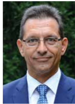
Dr. Edmund Roehlich

Eine umfassende betriebliche oder einzelvertragliche Regelung ist die beste Möglichkeit, um Sicherheit für die noch vielen Graubereiche zu gewinnen.