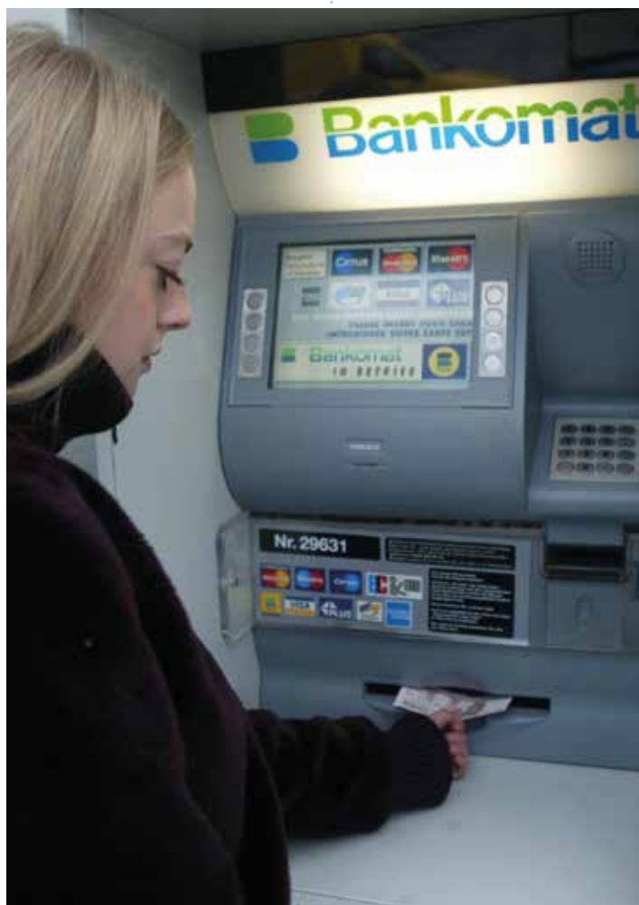
BANKEN MÜSSEN ENTGELTE für Bankomatabhebungen „im Einzelnen“ aushandeln.

Die Aufhebung des § 4a VZKG wurde mit Veröffentlichung des Erkenntnisses (G 9/2018) im Bundesgesetzblatt wirksam.